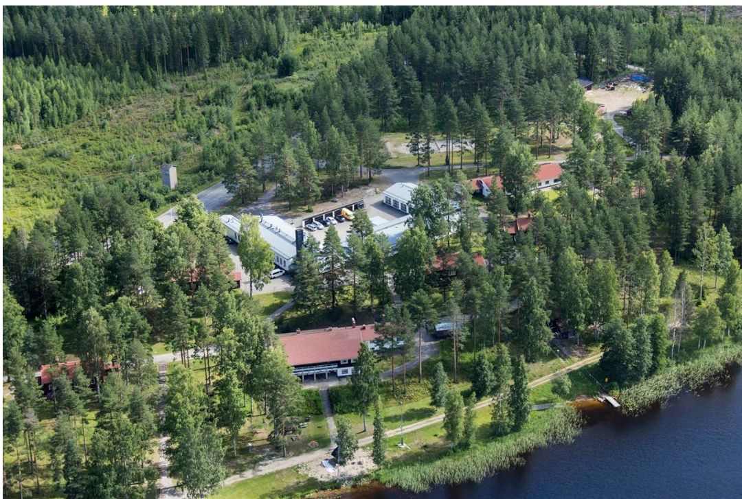
Bild 2 Flygfoto på Sulkava fängelse. Vy från sjön.