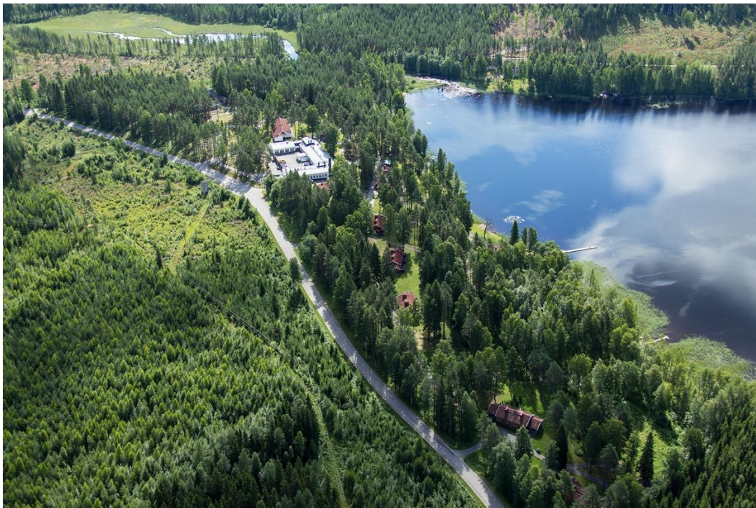
Bild 1 Flygbilder på och karta över områdesgränser i Sulkava fängelse.