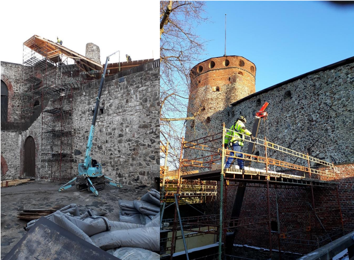
Bild 4 I bilden ses arbetsplatsen på Olofsborg både innanför och utanför murarna.